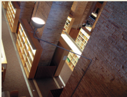
BIBLIOTECA DEL DIPÒSIT DE LES AIGÜES

Operar conjuntament amb tots aquests indicadors ha fet possible establir un rànquing qualitatiu de les millors biblioteques universitàries i científiques espanyoles, en què cinc biblioteques universitàries catalanes estan entre els deu primers llocs de la classificació. Així doncs, l'encapçala la UPF i, a continuació i per aquest ordre, trobem les biblioteques de les universitats Internacional de Catalunya, Pública de Navarra, Navarra, Lleida, Girona, Salamanca, SEK, Carlos III de Madrid i, en desena posició, la Universitat de Barcelona.