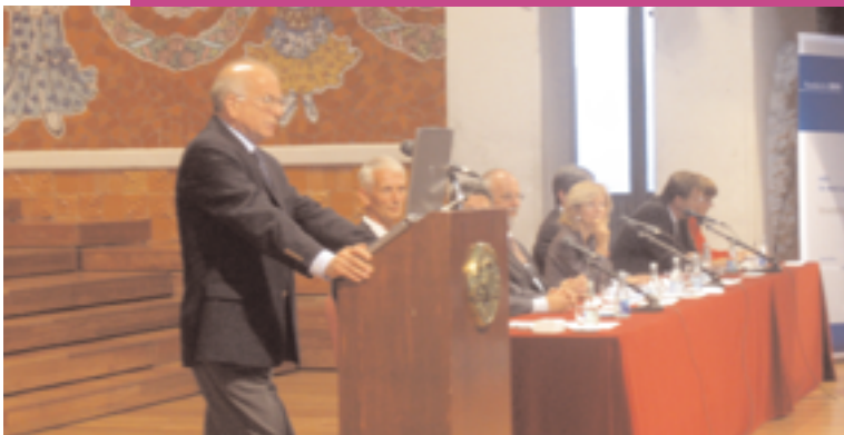
DANIEL KAHNEMAN, A LA SESSIÓ DE CLOENDA