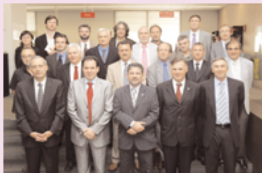
ELS MEMBRES DEL PATRONAT DE LA FUNDACIÓ BARCELONA MEDIA UNIVERSITAT POMPEU FABRA