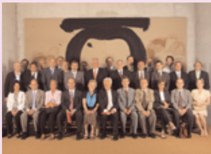
ELS MEMBRES DEL FÒRUM SOCIAL I EMPRESARIAL DEL CONSELL SOCIAL

la programació universitària; la promoció, avaluació i seguiment de la inserció laboral dels titulats, i l'aplicació del coneixement i la recerca universitàries a les necessitats de la societat i del teixit productiu, entre d'altres.