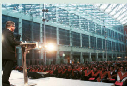
EL RECTOR ES DIRIGEIX ALS NOUS GRADUATS