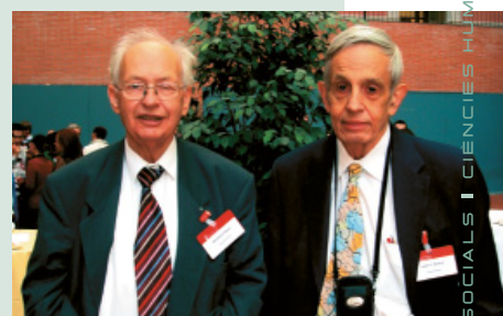
REINHARD SELTEN I JOHN F. NASH