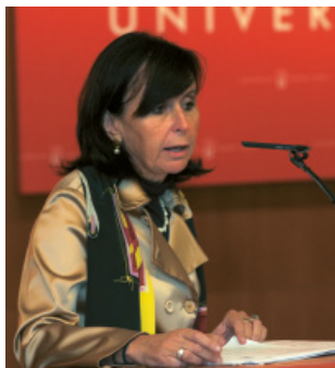
MARIA EMILIA CASAS

María Emilia Casas, presidenta del Tribunal Constitucional, va inaugurar la primera edició del màster oficial en Ciències Jurídiques, organitzat pel Departament de Dret. Després de signar en el Llibre d'Honor de la UPF, va pronunciar la lliçó "El Tribunal Constitucional en la actualitat", en què va exposar diferents qüestions i vicissituds relacionades amb l'òrgan judicial que presideix, màxim intèrpret de la Constitució.