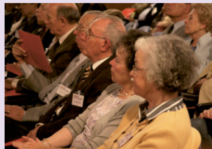
ASSISTENTS A LES JORNADES

El resultat del material recollit a partir de les entrevistes personals (fetes a 51 persones, entre membres de les Aules de la Gent Gran i altres entitats o institucions participants) són els cinc volums de l'obra Cinquanta-u veus trenquen el silenci , que recullen àmpliament els relats continguts en les més de deu mil citacions produïdes.