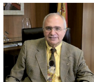
JAUME GARCÍA VILLAR

Jaume García Villar, catedràtic d'Economia Aplicada de la UPF, va ser nomenat en la sessió del Consell de Ministres del passat 25 d'abril, a proposta del ministre d'Economia, Pedro Solbes, nou president de l'Institut Nacional d'Estadística (INE), en substitució de Carmen Alcalde.