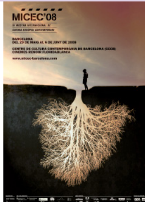
CARTELL MICEC 08

La quarta edició de la Mostra Internacional de Cinema Europeu Contemporani (MICEC'08) es va presentar a Barcelona del 29 de maig al 6 de juny. Va incloure la projecció de pel·lícules no estrenades a Espanya i dels films i propostes més arriscades del continent; la presència de directors, crítics i teòrics de renom; dos simposis internacionals; la participació de 25 universitats europees, o la celebració de divuit taules rodones i nombrosos debats públics.