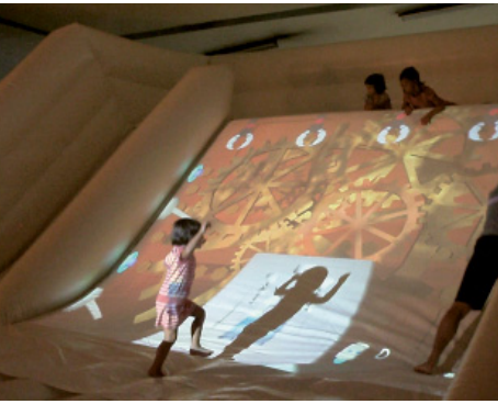
EL TOBOGAN INTERACTIU

Al campus de la Comunicació - Poblenou es va instal·lar el tobogan interactiu desenvolupat pel Laboratori de Sistemes Interactius, del qual Narcís Parés n'és investigador i que està vinculat a l'Institut Universitari de l'Audiovisual per tal d'iniciar una sèrie d'experiències per mesurar i controlar l'activitat física que duen a terme els infants mentre juguen de manera interactiva. Una línia de recerca que busca trobar elements objectius per poder ajustar l'activitat física dels infants als seus requeriments òptims en termes de salut.