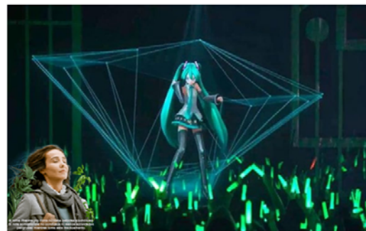
Hatsune Miku ofreciendo un concierto.

Lo tiene todo. Es joven, guapa, canta, baila, ha triunfado en su Japón