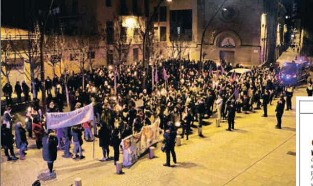
Dones manifestant-se aquest mes a Manresa contra les violacions que han tingut lloc el 2019

put rellització viu en endemència al veu-la és po-nen-ne-sun-fil-ede-la té és lesbic i rirma s'em-ment, rra-ti-que via al-er-ti-la