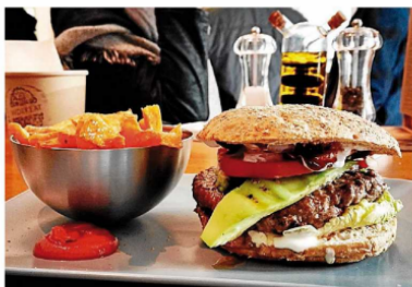
España está en cuarto lugar en el ranking de obesidad infantil en Europa.

BRUNO DIAZ Barcelona Más del 40 % de los niños españoles son obesos o tienen sobrepeso, dato que sitúa a España a la cabeza de Europa en obesidad infantil. Uno de los frentes que hay que atacar para afrontar un problema de salud pública que es multifactorial es la publicidad alimentaria dirigida a menores. La evidencia es un estudio publicado en acceso abierto en la revista Nutrients , de tres investigadoras, dos de la Universitat Oberta de Catalunya (UOC) y una de la Universitat Pompeu Fabra (UPF), en el que las expertas recomiendan más control sobre los anuncios de productos de bajo valor nutritivo y más restricciones para el conjunto de normas que autorregulan la publicidad alimentaria dirigida a un público infantil. El estudio revela que el Código de autorregulación de publicidad de alimentos y bebidas dirigidas a menores