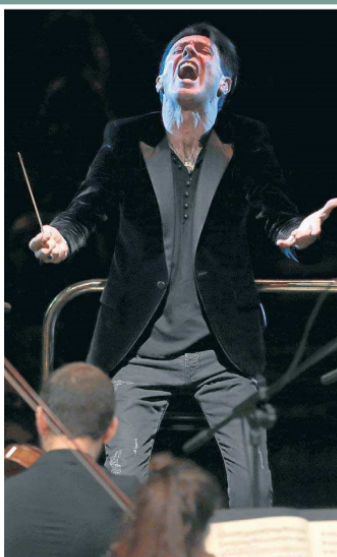
El cervell dels músics com Ezio Bosso (a la imatge) mostra una activitat més

Toni Pou N'hi ha prou amb escoltar la primera paraula que diu un conegut quan despenja el telèfon per saber si ha tingut un mal dia. Fins i tot la gent convinguda de no tenir oïda és capaç de percebre-ho. Com que tenim una tendència natural a buscar patrons, a comunicar-nos i a explicar històries, som especialment hàbils detectant emocions en els altres. I, per això mateix, estem especialment dotats per a la música.