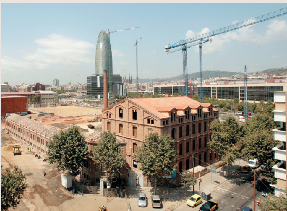
VISTA DE LES OBRES DEL NOU CAMPUS, A CA L'ARANYÓ