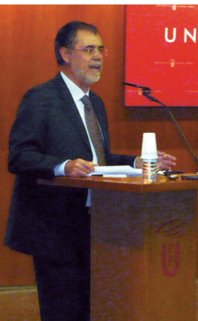
MARIANO FERNÁNDEZ BERMEJO