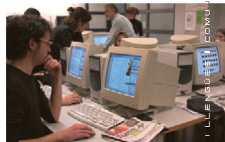
ESTUDIANTS DE PERIODISME TREBALLANT A LA "REDACCIÓ" DE RAMBLA

Com a novetat d'enguany, un grup de sis alumnes escollits a partir d'un càsting de TV3, va haver de comunicar minut a minut el desenvolupament de la nit electoral des de les seus dels partits a través del portal web de la Corporació Catalana de Mitjans Audiovisuals 3cat24.cat, informació que quedava recollida en un bloc.