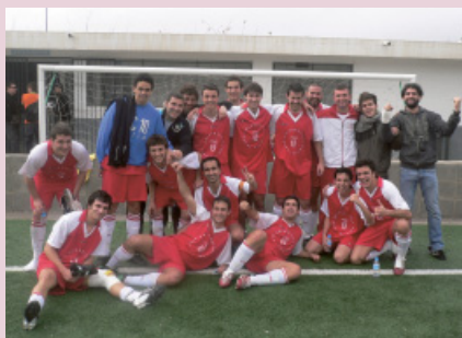
SELECCIÓ MASCULINA DE FUTBOL DE LA UPF

Amb aquesta victòria, la formació de la UPF es va classificar de manera directa per al Campionat d'Espanya Universitari de futbol, que transcorrerà a Castelló del 21 al 24 d'abril, organitzat per la Universitat Jaume I, i amb les vuit millors seleccions universitàries d'Espanya. Altres resultats destacables pel que fa a les seleccions de la UPF van ser la segona posició de la selecció de bàsquet masculí, després de guanyar a les semifinals a la UAB (77-64) i perdre la final davant la UB (70-80); i les terceres posicions dels equips de bàsquet femení i futbol sala masculí.