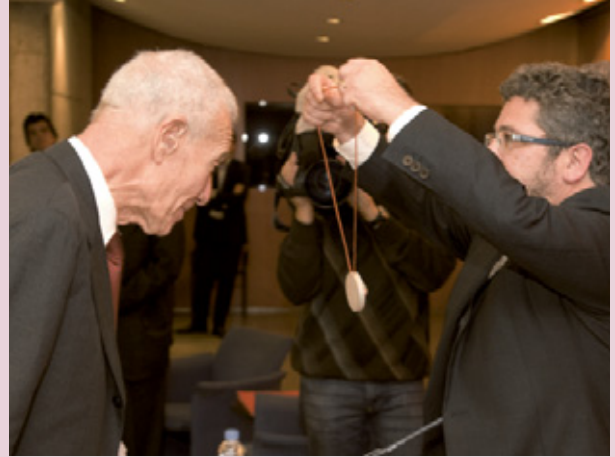
EL RECTOR INVESTEIX EL DOCTORAND