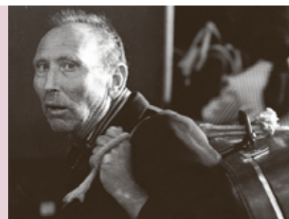
EMIGRANT A L'ESTACIÓ DE FRANÇA. BARCELONA, 1977

És un homenatge a totes aquelles dones i homes que, al llarg del segle passat, van triar Barcelona com a destinació i que han contribuït decisivament a construir la Catalunya d'avui. Entre l'any 1950 i el 1975 van arribar a terres catalanes més d'un milió de persones. El somni de Barcelona combina reportatges i entrevistes a plató i s'estructura en nou capítols. Recull, a través de més de 100 testimonis, la història dels nous catalans del segle xx, els motius que els van empènyer a deixar els seus llocs d'origen, com va ser l'experiència del seu propi viatge i com es va desenvolupar la seva vida a Catalunya fins a l'actualitat.